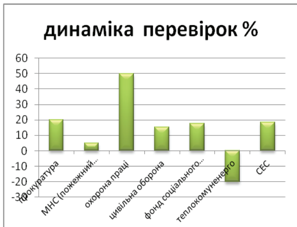
Рис. 2. Динаміка перевірок навчальних закладів в 2012-2013 роках

повноваження. В Указі регламентовано порядок здійснення перевірок, а саме планові виїзні перевірки проводяться всіма контролюючими органами одночасно в день, визначений органами державної податкової служби, а порядок координації проведення перевірок встановлюється Кабінетом Міністрів України.