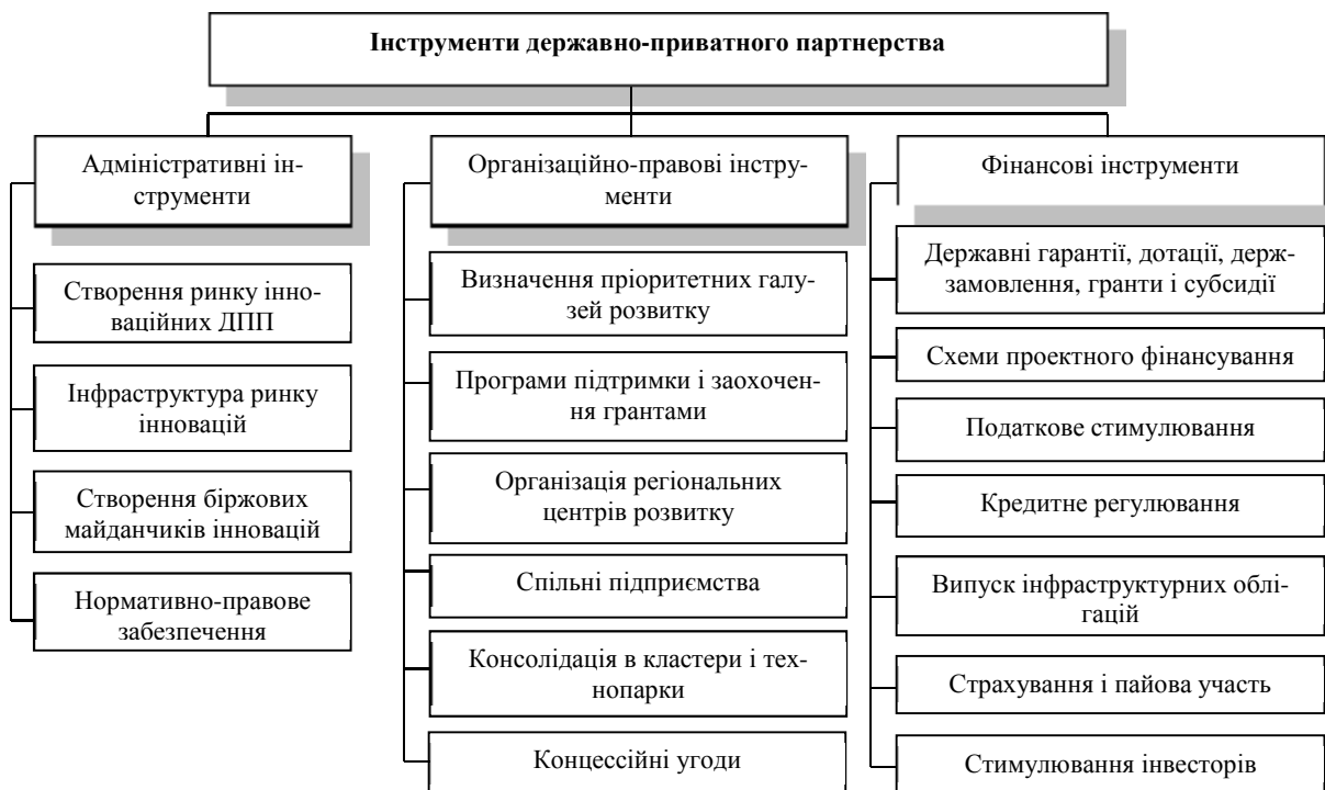
Рис. 2. Інструменти ДПП, які використовуються в сфері підтримки інновацій