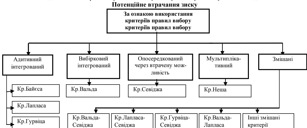
Рис. 4. Деталізація потенційного втрачання зиску за ознакою використання критеріїв правил вибору