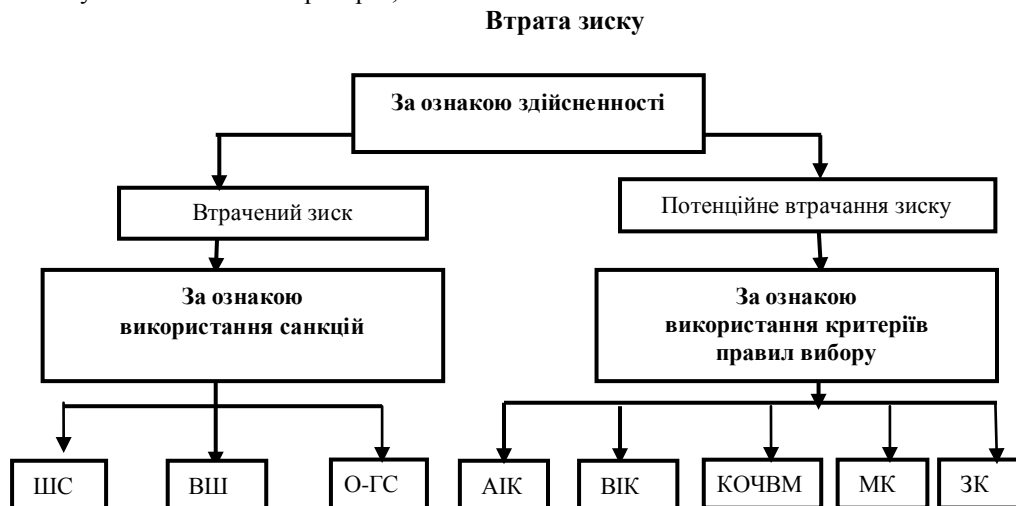
Рис. 3. Види показників втрати зиску та їхнє місце у класифікації втрати зиску за ознакою здійсненності

Так, згідно з рис. 3 можна побачити, що втрату зиску за ознакою здійсненності може бути поділено на втрачений зиск (фактичну втрату зиску) та потенційне втрачання зиску (зиск, що може бути втрачено у зв'язку із невірним вибором альтернатив діяльності). Термін фактичний втрачений зиск широко використовують в юридичній практиці, його застосовують при обґрунтуванні претензій пов'язаних з невиконанням, або неналежним виконанням контрагентами своїх зобов'язань. Але практика господарювання вказує на більшу актуальність не оцінки обґрунтованих претензій відшкодування (це питання є досить розглянутим, зокрема у юриспруденції), а на оцінку вартості хиб прийняття управлінських рішень, тобто не фактичних значень втраченого зиску, а оцінки значень потенційного втрачання зиску, адже оцінювання втрати зиску та мінімізації його негативних наслідків є одним з головних завдань служби економічної безпеки підприємства. Тому виникає необхідність проведення більш детальної класифікації потенційного втрачання зиску.