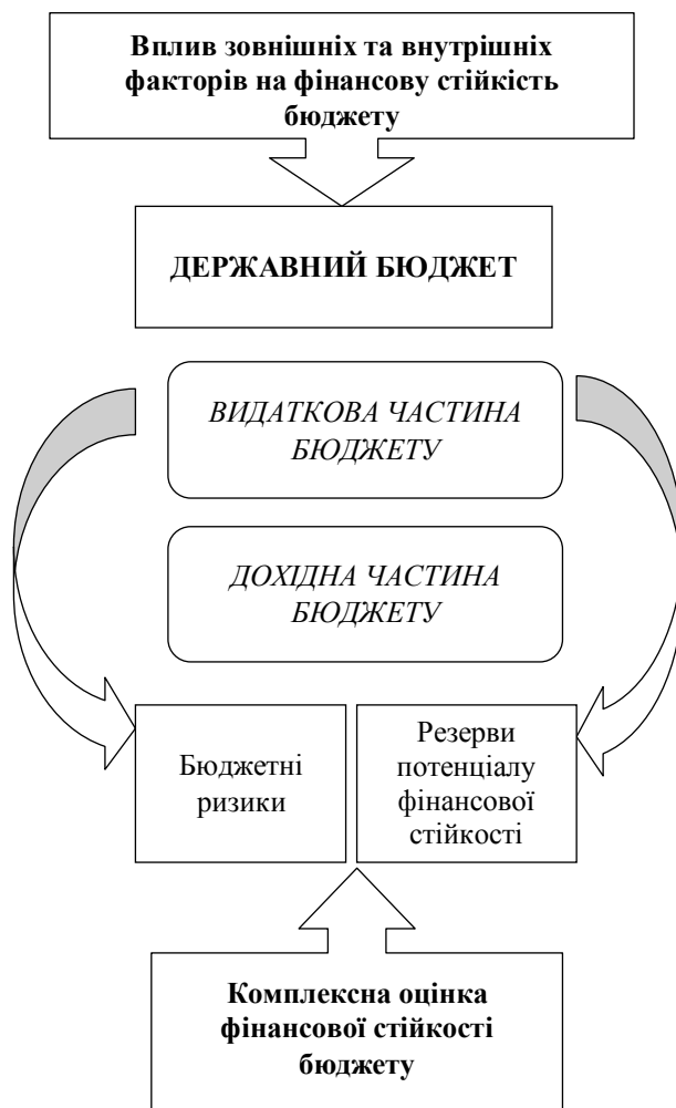
Рис. 2. Оцінка результату впливу на стійкість бюджету

джету, а значить – на його стійкість. Результати впливу можуть призвести як до негативних явищ – появи бюджетних ризиків, що зменшує рівень стійкості бюджету, так і до позитивних – створення нових можливостей ефективного використання бюджетних коштів. Серед ключових бюджетних ризиків можна виділити наступні: на стадії складання та затвердження бюджету, виконання бюджету, здійснення контролю та складання звітності.