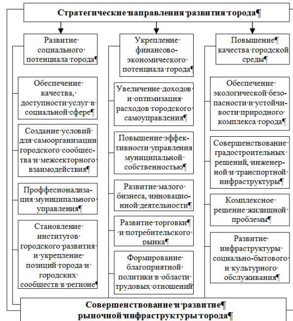
Рис. 2. Стратегические направления развития города и их взаимодействие с рыночной инфраструктурой

рода (страны) экономическим кризисам. Устойчивость также требует учета таких неэкономических потребностей человека, как потребности в образовании, здоровье, высоком качестве окружающей среды.