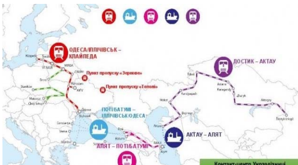
Рис. 2. Новий напрямок «Шовкового шляху» (за інформацією контакт-центру Укрзалізниці)

Для подальшого інноваційного розвитку підприємств залізничного комплексу потрібно розробити конкретну концепцію інноваційного розвитку. Основною метою даної концепції повинна бути постановка її на методологічну основу технологічного розвитку залізничного комплексу на принципах забезпечення сталого економічного зростання.