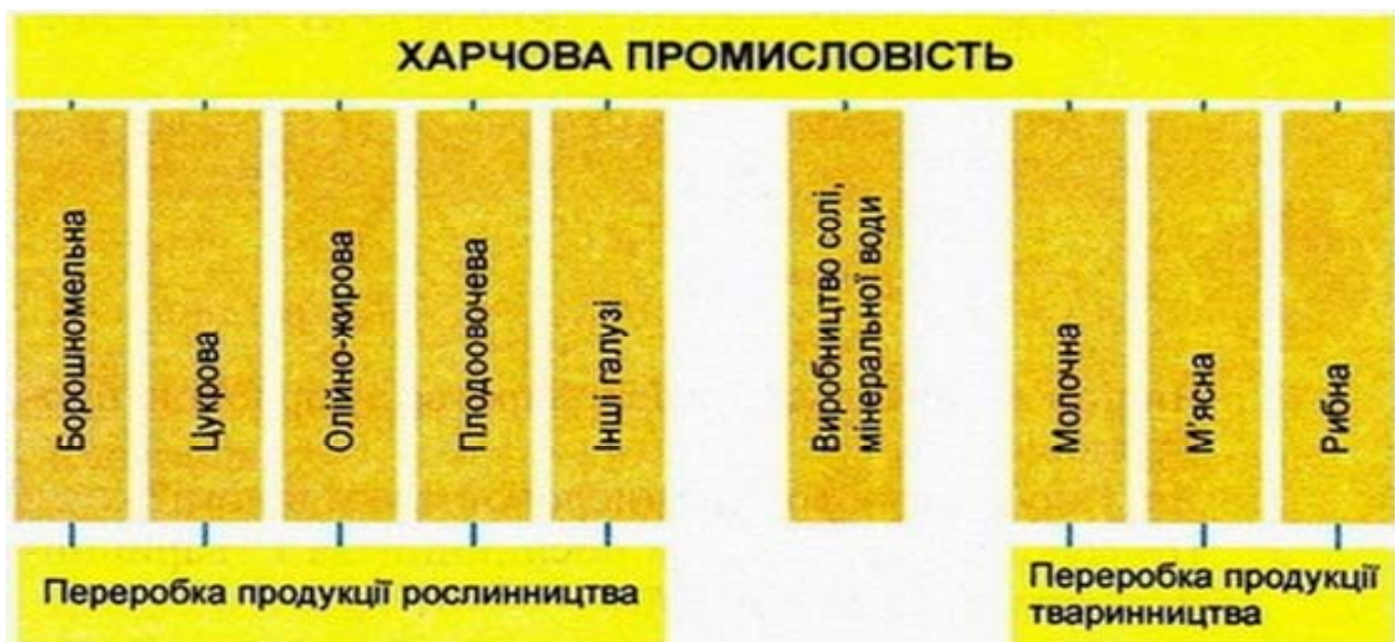
Рис. 1. Галузевий склад харчової промисловості

За результатами проведеного аналізу техніко-економічних показників розвитку харчової промисловості України можна стверджувати, що промисловість потребує: забезпечення реальних заходів з енергоефективності (перехід на альтернативні види палива, заміна обладнання на більш енергоефективне, організація виробництва біопалива, переробка відходів на біогаз, випуск додаткової продукції шляхом забезпечення глибини переробки), гарантування високої якості продукції (удосконалення законодавства, гармонізація стандартів, розробка та