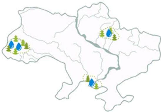
Рис. 1. Місця розташування заводів ВАТ «Нова» на карті України

ТОВ «Нова» отримало виключні права постачання унікальної води ТМ «Аляска» та ТМ «Старий Миргород». Питна вода «Аляска» – це кришталево чиста вода європейської якості, у якій завдяки дбайливому очищенню Anti Scale Complex зберігається ідеальний баланс корисних мінералів і є ідеальною для пиття та приготування їжі. «Старий Миргород» – це негазована питна вода з курортного регіону України. Має джерельний смак, абсолютну чистоту, м'якість та унікальну позитивну біоенергетику. Вода ідеальна для щоденного споживання в «живому» (некип'яченому) вигляді для вгамування спраги. Крім того, є ідеальною для приготування їжі та різноманітних напоїв для всієї родини.