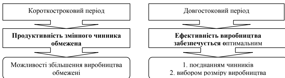
Рис. 2. Принципи здійснення аналізу виробництва в короткостроковому і довгостроковому періодах

Подальший етап комплексного аналізу виробничо-економічного розвитку галузей спрямований на визначення шляхів вдосконалення низькоефективних секторів.