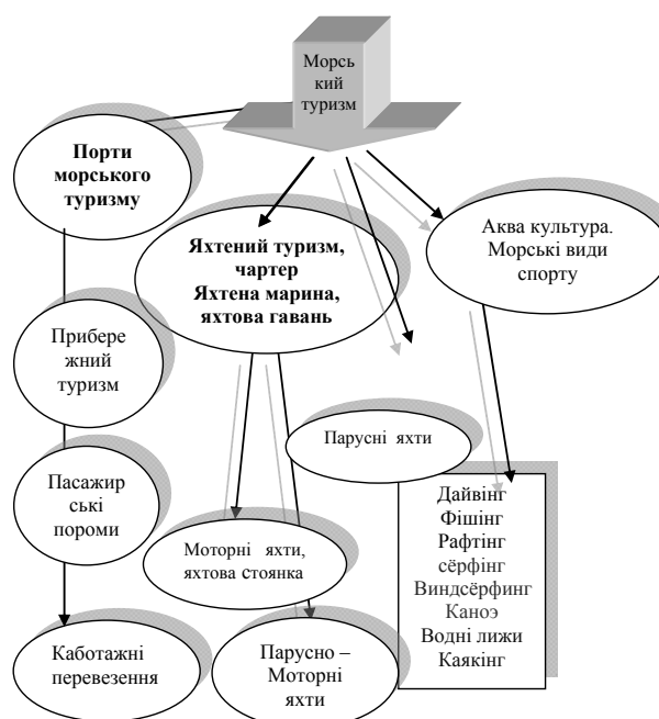
Рис. 1. Морський туризм як сукупність багатофункціональних заходів

темпи приросту три основні складові частини морського - туризму(марини для яхт, яхтений чартер та круїзна(cruises) промисловість. Явище «морського туризму» уявляє собою аспект туризму взагалі, від якого й пішов цей підтип. Отже, питання визначення терміну «морський туризм» слід розглядати в контексті загального визначення туризму (рис.1.)