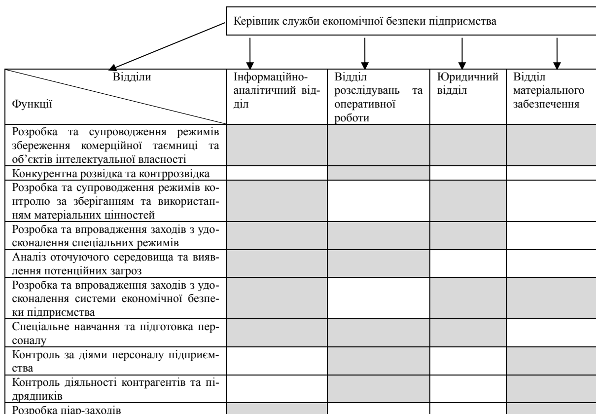
Рис. 2. Фрагмент організаційної структури служби економічної безпеки підприємства (за мета-напрямом: захист)

Матрична організаційна структура існує саме для таких випадків, коли управлінські процедури слабо регламентовані. У матриці поєднуються рядки та стовбці. У стовбцях знаходяться постійні відділи служби економічної безпеки підприємства, а у рядках – виконувані службою функції. Позначка у клітинці на перетині рядків та стовбців (на рис. 2 ця позначка являє собою сіру заливку клітинки) означає участь певного відділу у реалізації певної функції. Відповідно до сутності матричної оргструктури, кожна з виконуваних функцій має відповідальну особу, яка, по суті, є тимчасовим керівником, що виконує свої керівні обов'язки до тих пір, доки виконується ця функція. Керівник служби економічної безпеки одночасно є лінійним керівником по відношенню як до начальників постійних відділів, так і тимчасових керуючих за окремими функціями. Коротко розглянемо призначення постійних відділів. Слід відзначити, що слід окремо розглядати комплекси завдань, які можуть виконуватися цими відділами взагалі, та завдання, які виконуються відділами у межах певних функцій.