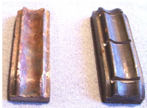
Рис. 3. Чавунні контактні вставки

Деякі водії, щоб мати стратегічний запас, особливо для несприятливих погодних умов "виходять з положення" наплавляючи зношені металеві вставки, не думаючи про наслідки використання такого ноу-хау (рис. 4).