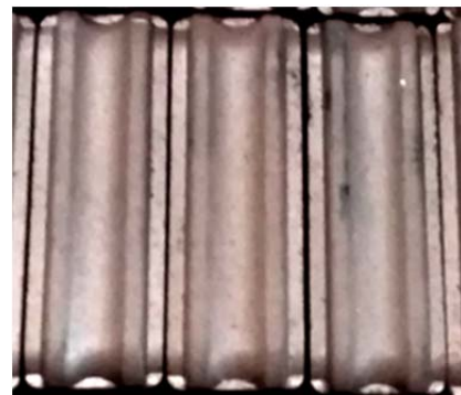
Рис. 6. Контактні вставки БрЗГ-6Тр

У лютому 2018 року випробувані контактні вставки БрЗГ-4Тр (висота робочої зони 6 мм) на тривісному зчленованому тролейбусі "Škoda 15TrM" № 602 в умовах депо і на маршруті №3.