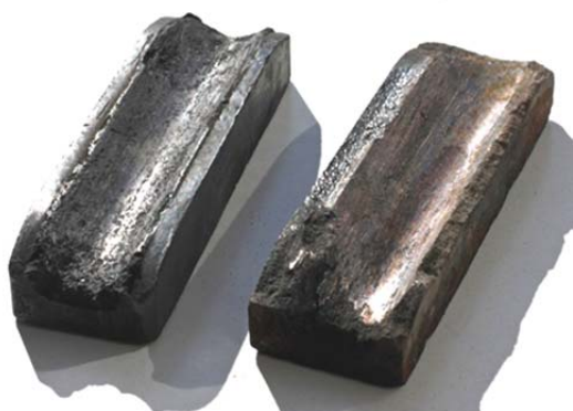
Рис. 1. Вугільні контактні вставки

Постановка проблеми. На даний час тролейбусні депо України, і зокрема у Львові, використовують в якості електричних ковзних контактів вуглецеві (вугільні) вставки з коксу, або графіту (рис. 1).