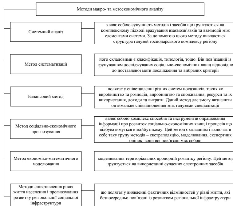
Рис. 3. Традиційні методи макро- та мезоекономічного аналізу