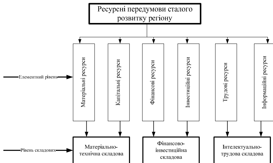
Рис. 2. Принципова схема взаємозв'язків рівнів інтеграції елементів та складових розвитку регіонів

У наукових дослідженнях регіонального розвитку використовується низка загальних та спеціальних методів наукового пізнання. М.І. Небава та Л.М. Ткачук розглядають інструментарій макро- та мезоекономічного аналізу, виокремлюючи такі його методи (рис. 3) [10].