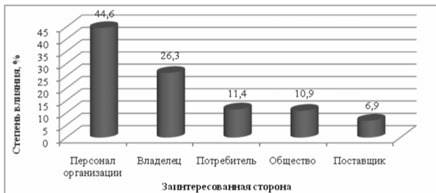
Рисунок 2 – Степень влияния на удовлетворение требований и ожиданий заинтересованных сторон деятельности организации после прохождения процедуры сертификации ее системы менеджмента на соответствие требованиям МС SA 8000

Анализ показал, что следующей заинтересованной стороной является собственно владелец (акционеры) организации. Это явно свидетельствует, что выполнение требований МС SA 8000, а также сертификация системы менеджмента предприятия на соответствие его требованиям оказывают благоприятное воздействие на получение устойчивого дохода организацией, в результате - снижение показателя «текучести кадров» и повышение ответственности персонала за свою деятельность.