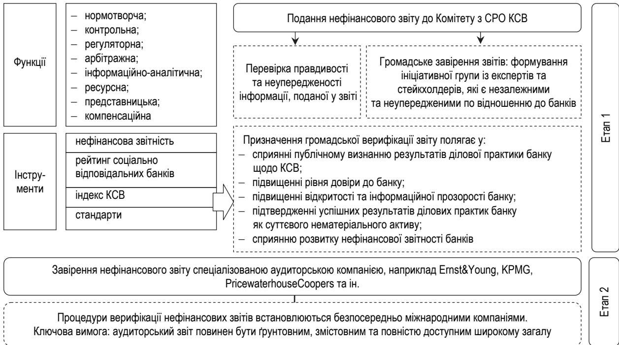
Рисунок 1 – Ключові аспекти функціонування саморегулівної організації на ринку банківських послуг України за напрямком КСВ

Концепція корпоративної соціальної відповідальності має три рівні відповідальності – правову, економічну та соціальну (філантропічну).