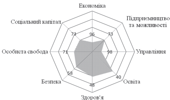
Рис. 1. Ранжирування складових індексу процвітання для України, 2010 рік

Проаналізувавши комплекс самого індексу, де серед восьми досліджуваних субіндексів (рис. 1 і 2): економіка ( Economy ), підприємництво та можливості ( Entrepreneurship and Opportunities ), управління ( Governance ), освіта ( Education ), здоров'я ( Health ), безпека ( Safety and Security ), особиста свобода ( Personal Freedom ) і соціальний капітал ( Social capital ) (до речі, включення останнього до одного з факторів добробуту є показовим щодо зростання практичного значення цього явища та поняття) спостерігаємо найнижчий рейтинг значення індексу управління – 121-ше місце із 147-ми країн (об'єднує рівні упевненості населення в уряді, судовій системі та рівень ефективності управління). Не менше занепокоєння викликають позиції «економіка» (включає рівень зростання ВВП на душу населення за п'ять останніх років – подано до 2010 року, рівень упевненості у фінансових інститутах і показник задоволеності стандартами життя) та «особиста свобода» (характеризує громадянські свободи і свободу вибору). І, на противагу вищезазначеним показникам, усе ще на передових позиціях перебуває освіта (29-те місце), рівень безпеки (56-те) і соціальний капітал (58-ме). Хоча дві останні позиції з великим відривом у гіршому становищі за освіту, але з більшим відривом кращі, ніж економічна та управлінська складові.