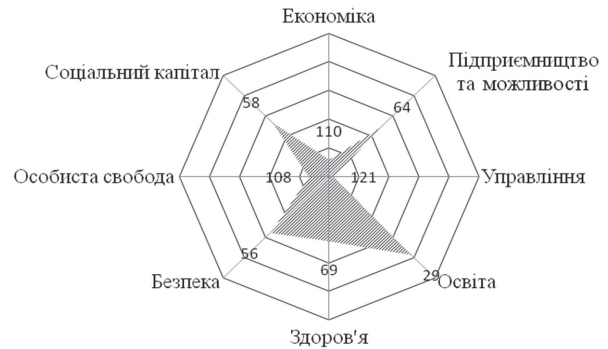
Рис. 2. Ранжирування складових індексу процвітання для України, 2012 рік

Зміна структури внеску кожного із субіндексів (місце у рейтингу) привертають особливу увагу в контексті процесу формування соціального капіталу. Наведені за цим рейтингом дані (засновані як на об'єктивних кількісних показниках, так і на суб'єктивних оцінках опитаних респондентів) демонструють певне становище речей і (у порівнянні з попередніми роками – див. рис. 1) тенденції соціально-економічного розвитку України, що формують національну модель економіки.