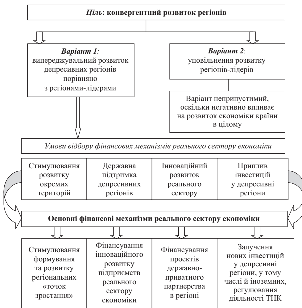
Рис. 2. Обґрунтування вибору фінансових механізмів реального сектору економіки для забезпечення конвергентного розвитку регіонів України

Обґрунтовуючи вибір фінансових механізмів розвитку реального сектору економіки, ми виходили з таких міркувань: