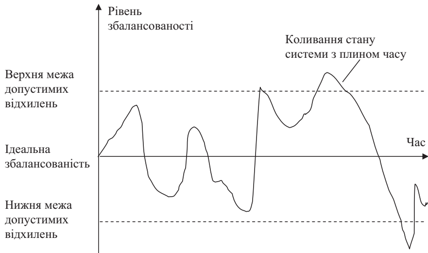
Рис. 2. Схематичне відображення принципу дії елементу збалансованості окремо взятої системи (авторська розробка)

плином часу. І головною метою в цьому разі є пошук шляхів урівноваження впливів позитивних і негативних факторів на досліджувану систему.