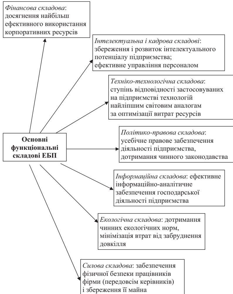
Рис. 2. Основні функціональні складові економічної безпеки підприємства

дом» конфіденційної інформації за межі підприємства.