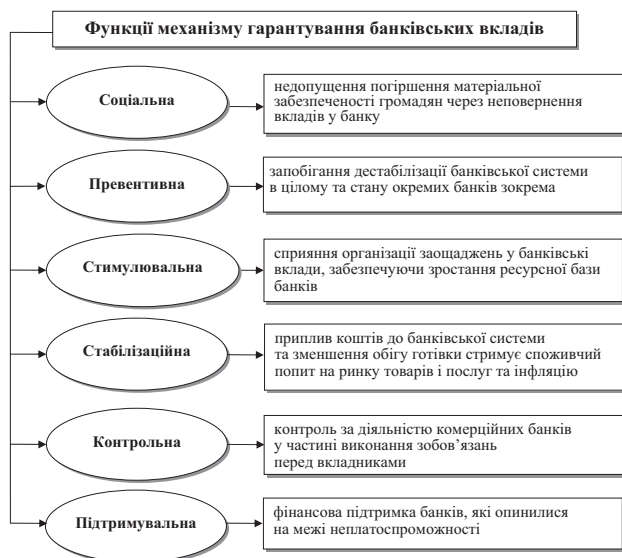
Рис. 1. Функції механізму забезпечення фінансової безпеки НПФ

На наше переконання, механізм гарантування банківських вкладів виконує сукупність функцій, що представлені на рис. 1.