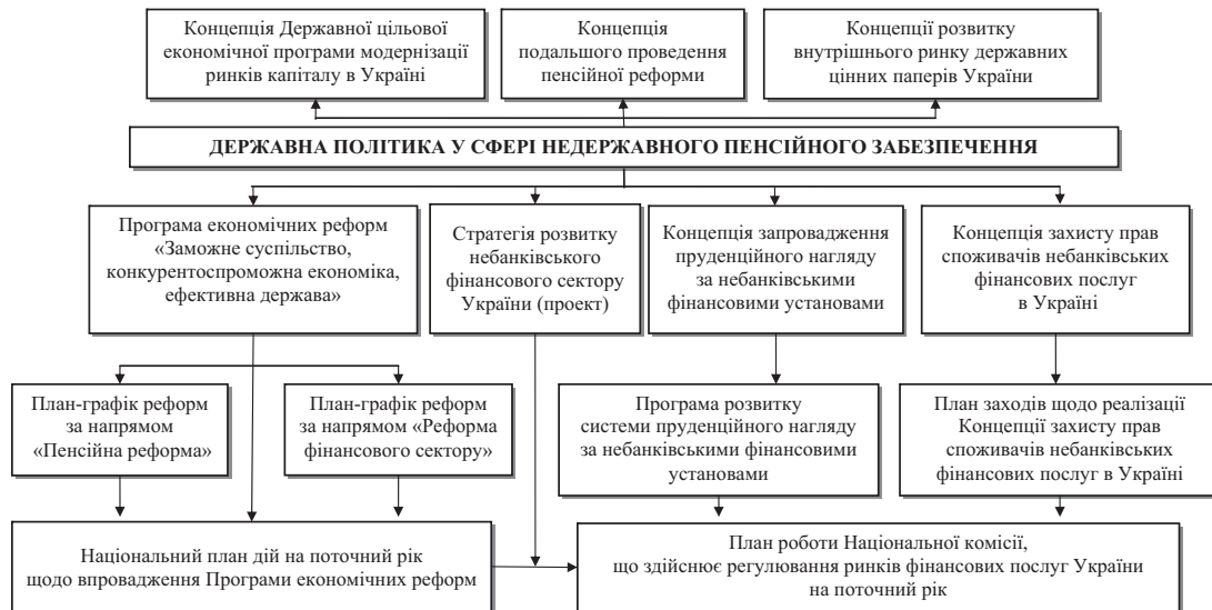
Рис. 3. Основні нормативно-правові акти державної політики у сфері недержавного пенсійного забезпечення

Основні концепції, які формують концептуальне середовище державної політики у сфері недержавного пенсійного забезпечення, наведено на рис. 3.