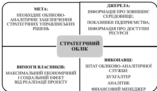
Рис. 2. Архітектура моделі стратегічного обліку на підприємстві

і як інформаційне забезпечення підтримки процесів створення, поширення, опрацювання й використання знань усередині підприємства (рис. 2).