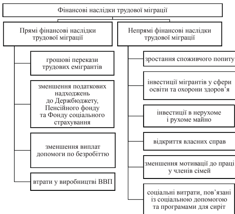
Рис. 2. Блок-схема комплексного аналізу фінансових наслідків трудової міграції

Велику роль в економічному розвитку країни відіграє стабільність банківської системи. Одним з необхідних чинників її забезпечення є збільшення обсягу депозитів населення, а згідно з дослідженнями міжнародної організації з міграції цілком передбаченою для 42 % переказаних коштів, є заощадження. Оцінка обсягу заощаджень домогосподарств трудових мігрантів, у формі депозитів у банках, дасть можливість оцінити їхній вплив на стабільність банківської системи і розвиток кредитно-фінансових інститутів.