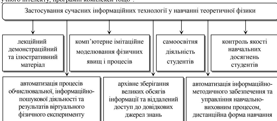
Рис. 1. Сфери застосування сучасних інформаційних технологій у навчанні теоретичної фізики в педагогічному університеті

Виклад основного матеріалу дослідження. Ефективна реалізація СІТ у практиці сучасної загальноосвітньої та вищої шкіл, що дозволяють суттєво підвищити якість освітнього процесу, починається з чіткого розуміння сутності та основних дидактичних функцій останніх. У своїй роботі ми керуємося визначенням базового терміну дослідження, запропонованого у монографії [1: 167]: "Засобами СІТ є програмно-апаратні пристрої, що функціонують на базі мікропроцесорної обчислювальної техніки, а також сучасні засоби і системи інформаційного обміну, що забезпечують операції зі збирання, продукування, накопичення, зберігання, обробки та передавання інформації. До засобів СІТ відносимо ЕОМ, ПЕОМ, комплекти термінального та периферійного обладнання, локальні мережі, пристрої для перетворення даних з графічної або звукової форми у цифрову і навпаки; сучасні засоби зв'язку; системи штучного інтелекту; програмні комплекси тощо".