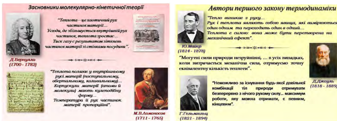
Рис. 3. З історії відкриття першого закону термодинаміки

У традиційному представленні зазначений методичний прийом займає значний інтервал часу. Використання мультимедійного супроводу процесу відтворення відомого (робота і теплопередача як основні способи зміни внутрішньої енергії термодинамічної системи) та розгляду нового (внутрішня енергія системи як однозначна функція/параметр її стану), встановлення математичного виразу внутрішньої енергії системи та з'ясування її залежності від числа ступенів вільності молекул ідеального газу дозволяє представити більшу за обсягом та глибиною розгляду інформацію, забезпечує високий темп її подання та ступінь наочності, а отже сприяє ефективності й результативності навчально-пізнавальної діяльності студентів (рис. 4).