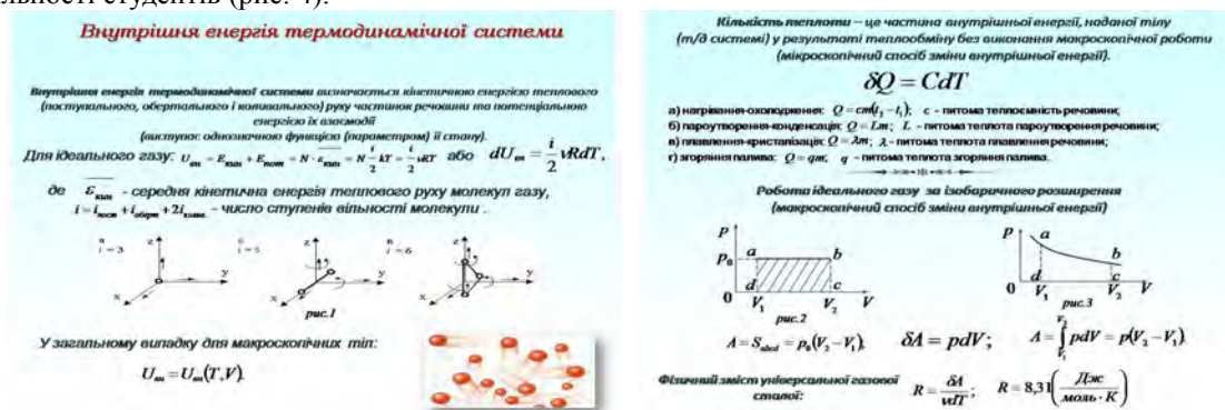
Рис. 4. Внутрішня енергія термодинамічної системи та способи її зміни

У традиційному представленні зазначений методичний прийом займає значний інтервал часу. Використання мультимедійного супроводу процесу відтворення відомого (робота і теплопередача як основні способи зміни внутрішньої енергії термодинамічної системи) та розгляду нового (внутрішня енергія системи як однозначна функція/параметр її стану), встановлення математичного виразу внутрішньої енергії системи та з'ясування її залежності від числа ступенів вільності молекул ідеального газу дозволяє представити більшу за обсягом та глибиною розгляду інформацію, забезпечує високий темп її подання та ступінь наочності, а отже сприяє ефективності й результативності навчально-пізнавальної діяльності студентів (рис. 4).