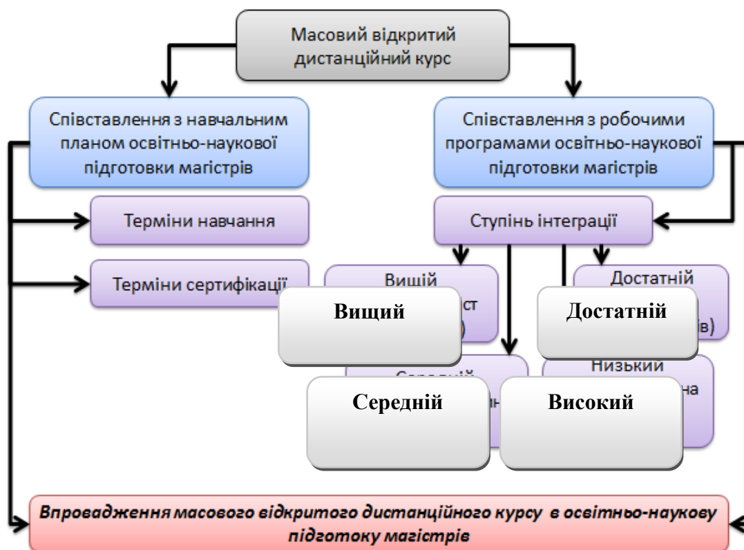
Рисунок 3. Принципова схема впровадження масового відкритого дистанційного курсу

Терміни кожного обраного масового відкритого дистанційного курсу співставлялись з відповідним семестром навчання, а терміни сертифікації з сесійними періодами. Зміст курсу співставлявся з навчальними планами та робочими програмами освітньо-наукової підготовки магістрів, визначався ступінь інтеграції [6].