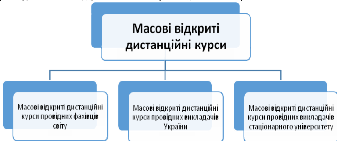
Рисунок 2. Розподіл типів масових відкритих дистанційних курсів

При підборі масових відкритих дистанційних курсів ми поділяли їх загальну кількість на три типи (рис. 2). Масові відкриті дистанційні курси провідних фахівців світу, викладачів України та викладачів університету, на базі якого відбувалась освітньо-наукова підготовка магістрів.