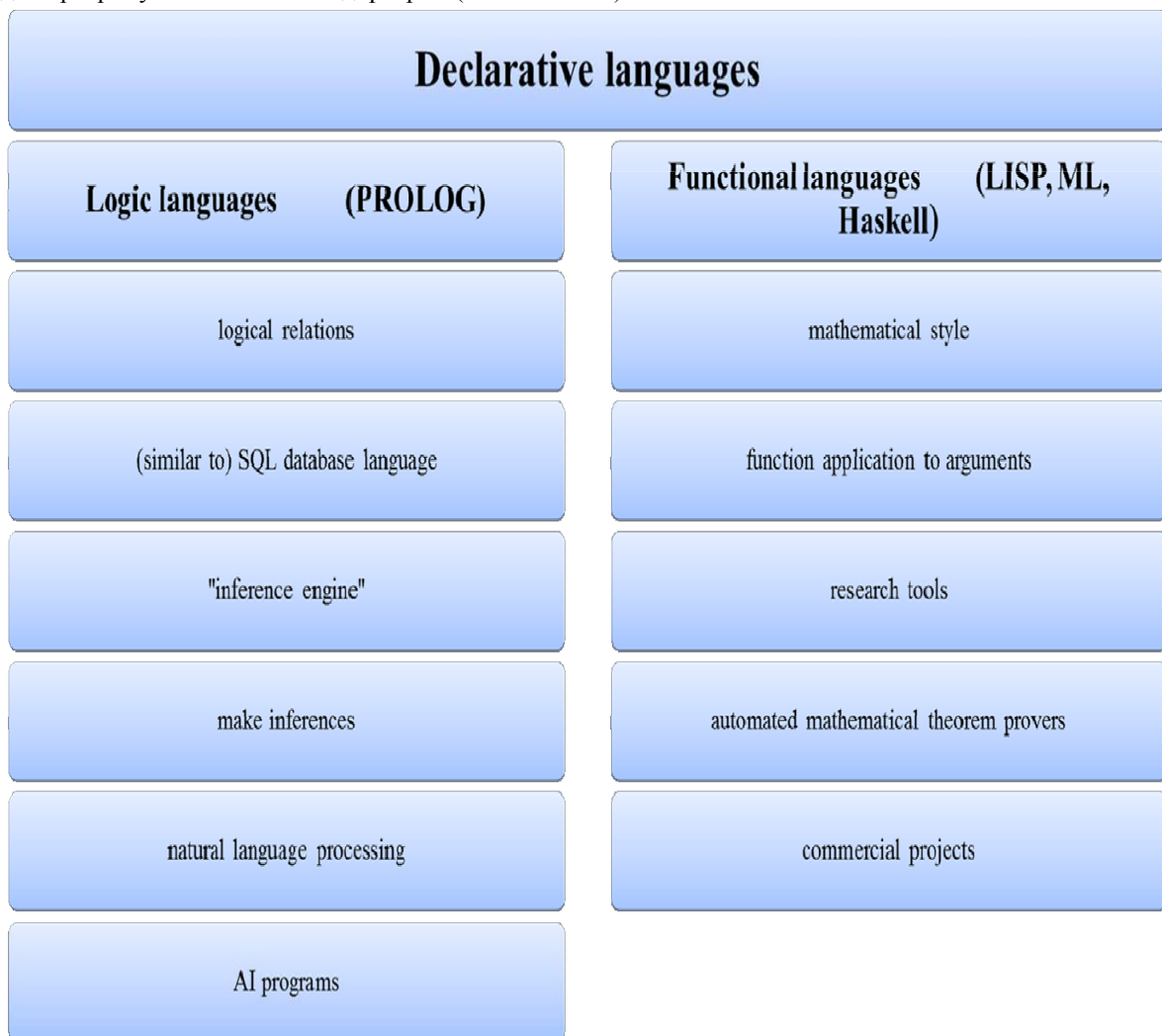
Рис. 3. Поняттєва схема теми Declarative Languages

Останньою об'єктно-орієнтованою мовою на рис. 2 є "Візуал Бейсик" ( Visual Basic ), яка була розроблена для розширення можливостей ( extended capabilities ) мови "Бейсик" ( Basic ) шляхом додавання об'єктів ( object adding ) та керованого подіями програмування ( "event-driven" programming ): клавіші, меню та інші елементи графічного інтерфейсу користувача ( graphical user interfaces ). Її використовують для програмування менших підпрограм ( small routines ).