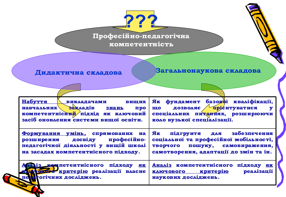
Рис. 2. Дидактична та загальнонаукова складові професійно-педагогічної компетентності викладача вищого навчального закладу

Проектне завдання виноситься на захист (бюджет часу для захисту – 10 хвилин) та реалізується з використанням аудіовізуальної підтримки (таблиці, схеми, презентації тощо).