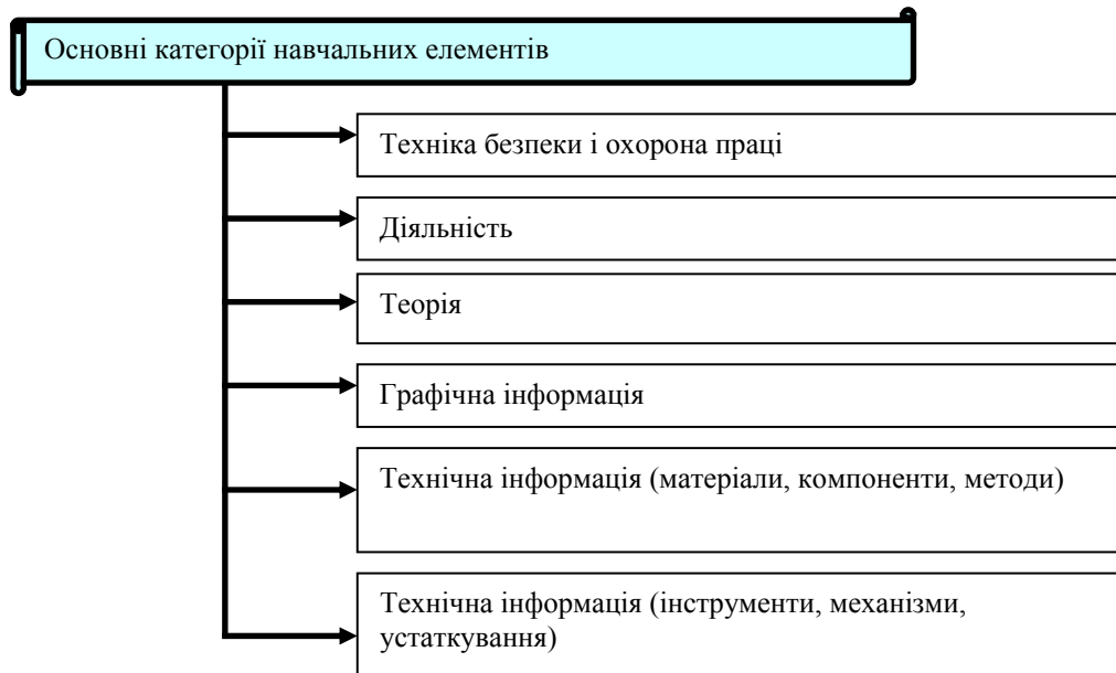
Рис. 1. Основні види навчальних елементів.

Подана в рис. 2 організаційна схема реалізації модульної технології навчання передбачає отримання кваліфікації, здобутої шляхом формального та неформального навчання для зайнятого і незайнятого населення через регіональні центри модульного навчання. У розвинених країнах відсутня тарифна система оплати праці, розряди, що замінені сертифікатом компетентності, котрі, здебільшого, відповідають ринковим умовам. Ціль навчального елемента формується, до прикладу, так: коли Ви закінчите вивчення цього навчального елемента, то зможете... (або Ви будете вміти...).