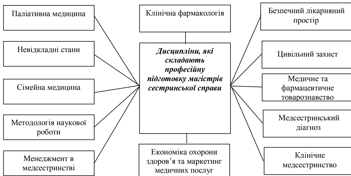
Рис. 2. Дисципліни, які забезпечують професійну підготовку магістрів сестринської справи.

магістрів сестринської справи здійснюється шляхом вивчення курсу "Українська мова (за професійним спрямуванням)". Метою курсу є підвищення рівня загальномовної підготовки майбутніх магістрів, мовної грамотності, комунікативної компетентності студентів, практичне оволодіння основами офіційно-ділового, наукового, розмовного стилів української мови, що забезпечить професійне спілкування на належному рівні, вироблення навичок оптимальної мовної поведінки у професійній сфері: вплив на співрозмовника за допомоги вмілого використання різноманітних мовних засобів, оволодіння культурою монологу, діалогу та полілогу; сприйняття і відтворення фахових тестів; засвоєння лексики і термінології свого фаху; вибір комунікативно виправданих мовних засобів; послуговування різними типами словників.