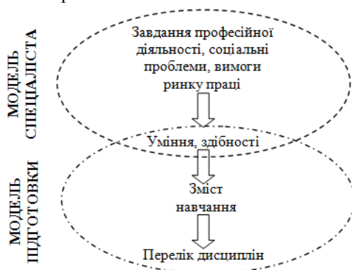
Рис. 1. Етапи моделювання процесу підготовки фахівця.

Модель підготовки визначає конкретні вимоги до освітнього процесу у вищій школі і дає відповідь на питання, що потрібно майбутньому фахівцю для успішного функціонування. Вимоги моделі фахівця є системоутворюючим фактором відбору змісту навчання і форм його реалізації у навчальному процесі, а також визначають якості, професійно важливі для кожної конкретної спеціальності. Схематично вищезначені моделі представлені на рис. 1.