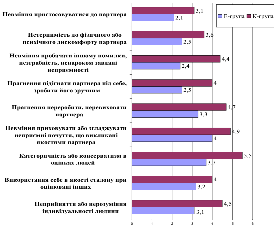
Рис. 1. Показники (М) шкал методики діагностики загальної комунікативної толерантності В. Бойко в експериментальній (Е) та контрольній (К) групах після тренінгу

Толерантність розглядається нами як соціальна установка, у єдності когнітивного, емоційного та поведінкового компонентів. Когнітивним компонентом толерантності є суб'єктивне визнання складності, багатовимірності різноманіття світу і непоєднаність множинності індивідуальних картин світу в єдиній "правильній" картині, розуміння природності відмінностей між людьми.