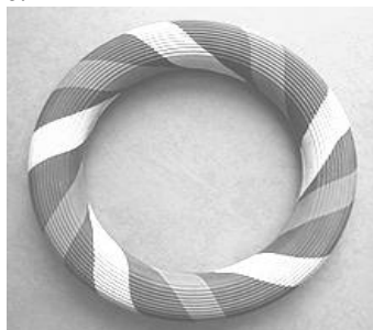
Рис. 2. Кільце ринго

втягнутої руки, від стартової лінії до поворотного прапора, оббігти його і повернутися до своєї команди, передавши кільце наступному гравцю. Якщо кільце упало, то рух потрібно починати з того ж місця. Виграє команда, яка закінчить естафету першою.