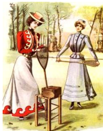
Рис. 2. Одяг представниць тенісу на рубежі XIX–XX ст.

На початку XX ст., на тлі зародження культу здоров'я та сильного тіла, жінки приділяли дедалі більше часу активному відпочинку і фізичній культурі. Жилет, одягнений поверх в'язаного джемпера і довга спідниця у широку складку – таким був жіночий спортивний костюм того часу. Однак для того, щоб позбутися стереотипу щодо одягу, знадобилося чимало часу.