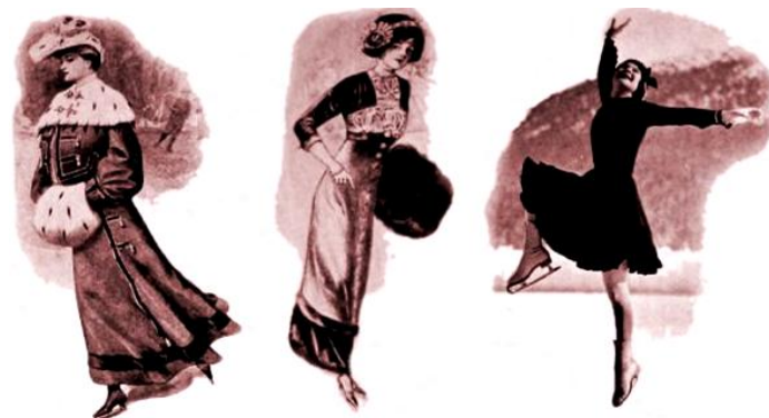
Рис. 4. Одяг представниць фігурного катання початку ХХ ст.

Деякі спортивні дисципліни, що практикувалися в особливих умовах, наприклад, лижні перегони, сприяли виникненню нових, спеціалізованих речей. У 30-х роках лижниці замінили довгі спідниці на