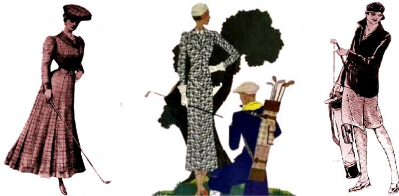
Рис. 3. Одяг гольфісток поч. ХХ ст. (1903, 1929 і 1935 рр.)

Неодмінним атрибутом спортивного костюма довга спідниця залишалася й для представниць таких видів спорту, як теніс, фігурне катання, гольф (рис. 3) і верхова їзда. Проте в середині 20-тих років відбулися різкі зміни у повсякденному одязі жінок: спідниці стали коротшими, костюм – більш вільним і неформальним. Уже до кінця 30-тих років жінки брали участь у багатьох видах спорту: плаванні, лижних перегонах, гольфі, легкій атлетиці, тенісі, альпінізмі, кульовій стрільбі, стрільбі з лука, фехтуванні, фігурному катанні, а також їзді верхи і на велосипеді (рис. 4).