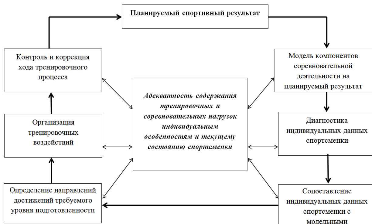
Рис. 1. Методика индивидуализации подготовки спортсменов в годичном цикле, специализирующихся в спринтерском беге

сравнению с другими бегуньями [3]. В целом, выявлена идентичность, как годовых объемов средств тренировки, так и основных тенденций в их распределении по мезоциклам у мужчин-спринтеров и маскулиных бегуний (достоверные различия отмечены лишь в объеме и распределении тренировочной нагрузки алактатной и гликолитической направленности, а также прыжковых упражнений).