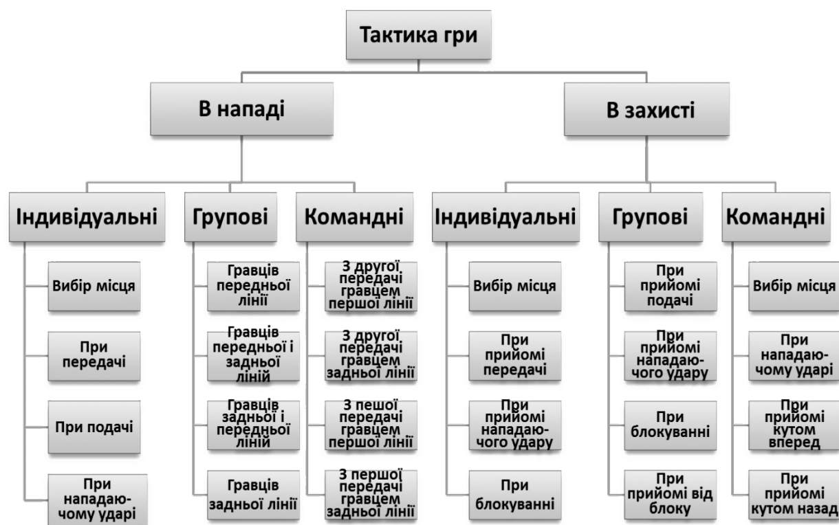
Рис. 2. Основні тактичні дії волейболістів

3. Провести етапний педагогічний контроль з метою визначення ефективності впроваджених засобів на рівень технічної підготовленості волейболістів високої кваліфікації.