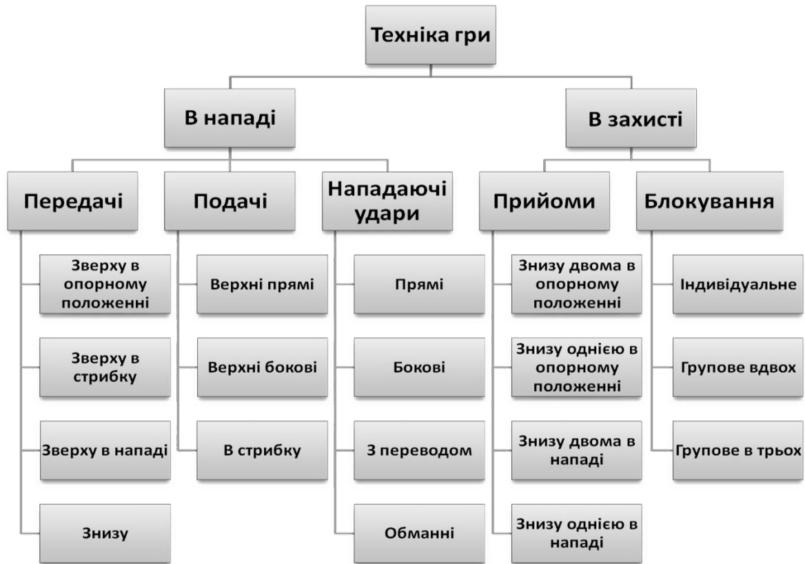
Рис. 1. Основні технічні дії волейболістів

Аналіз спеціальної літератури [2, 4, 5] з теорії і методики волейболу дозволив систематизувати основні технічні дії спортсменів, які використовуються в ігровій діяльності. Вони включають технічні дії в нападі та захисті. На рис. 1 представлена типова схема основних технічних дій, які використовуються в процесі навчання і вдосконалення волейболістів різних вікових груп та спортивних кваліфікацій.