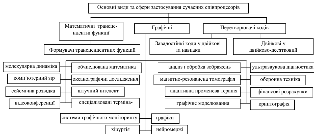
Рис. 1. Образно-знакова модель сфер застосування спеціалізованих співпроцесорів

чити виняткову продуктивність комп'ютерно-інтегрованих систем при реалізації інноваційних проектів в області виробництва, енергетики, оборонної техніки, медицини (рис. 1) та в інших галузях завдяки візуалізації та паралельній обробці інформації [6, 7].