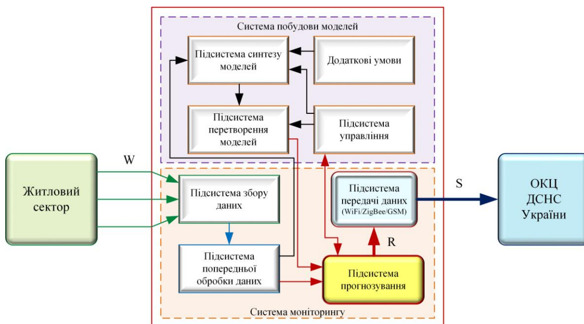
Рисунок 1 – Структурна схема комп'ютеризованої системи для реалізації методу прогнозування передумов виникнення пожеж у житловому секторі

До складу системи побудови моделей входять такі підсистеми: управління, синтезу моделей і перетворення моделей. Підсистема управління призначена для прийняття рішення на перебудову моделі за результатами прогнозування. Підсистема синтезу моделей працює з попередньо обробленими даними споживання електроенергії за певні проміжки часу та створює на основі методу групового урахування аргументів моделі конкретних квартир. Підсистема перетворення моделей відповідно перетворює синтезовані моделі в моделі, що допустимі для використання програмно-апаратними засобами підсистеми прогнозування.