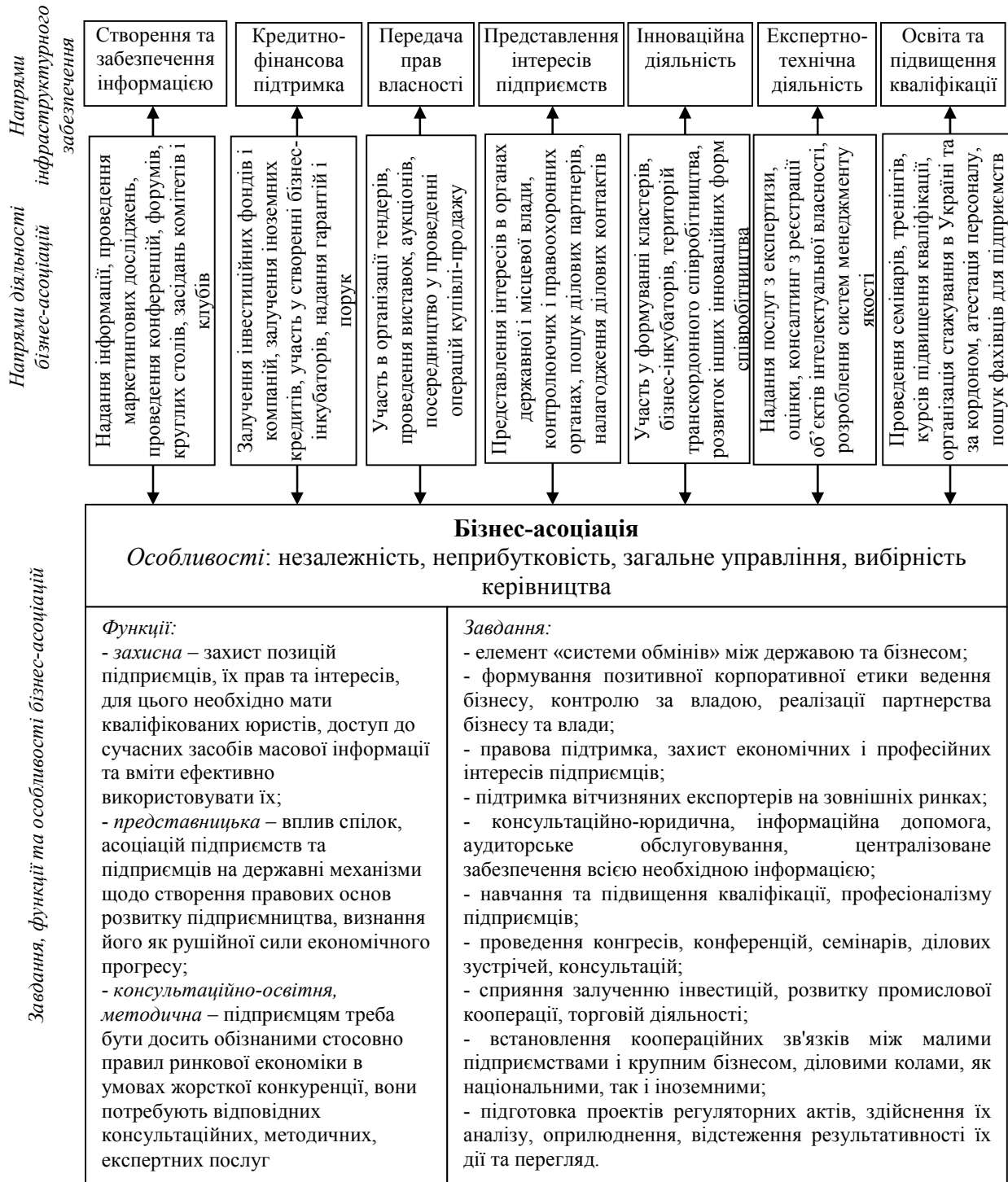
Рис. 2. Кореляція напрямів інфраструктурного забезпечення підприємництва зі сферами діяльності бізнес-асоціацій

Бізнес-асоціації як форма самоорганізації ділового співтовариства мають орієнтуватися на побудову ефективної інфраструктури підтримки малого та середнього бізнесу. Існування такого посередника між бізнесом, суспільством та владою забезпечує налагодження інформаційного мосту, дієвого важелю впливу бізнесу на владу і суспільство. Діяльність бізнес-асоціацій повинна базуватися на наукових принципах організації внутрішньої та зовнішньої взаємодії, носити системний характер. Це дозволить постійно підвищувати рівень бізнес-освіченості підприємств, ефективність менеджменту, застосовувати інструменти бізнес-планування та маркетингових досліджень за наявності консалтингової допомоги з боку спеціалістів бізнес-асоціації, налагоджувати партнерські відносини за допомогою участі у виставковій та ярмарковій діяльності, ділових місіях та тематичних зустрічах.