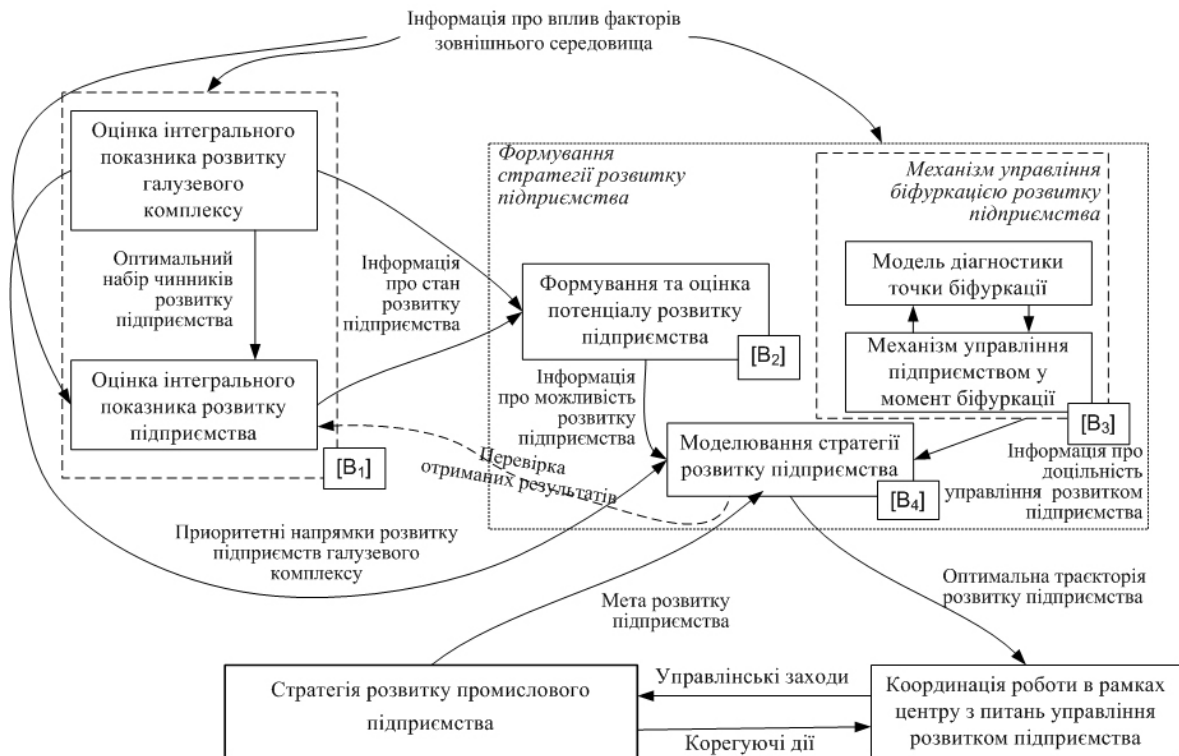
Рис. 1. Концептуальна модель управління розвитком промислового підприємства [11]

розвитком підприємства подати у вигляді процесної моделі, яка включає чотири основні функціональні підпроцеси (рис. 2).