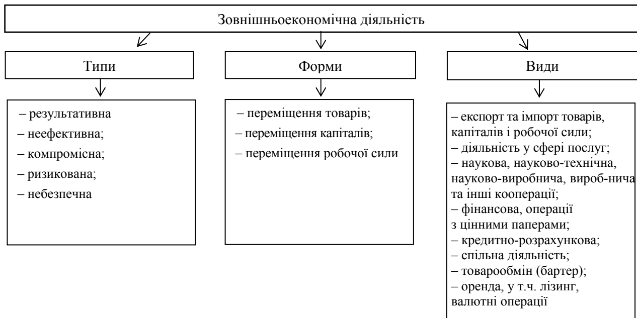
Рис. 1. Класифікаційні ознаки дефініції “зовнішньоекономічної діяльності” [6, с. 74]

На думку Л. Пісьмаченко [6, с. 74], поняття зовнішньоекономічна діяльність є складовою агрегованою економічною категорією, яка складається з окремих елементів і класифікується за типами, формами та видами (рис. 1).