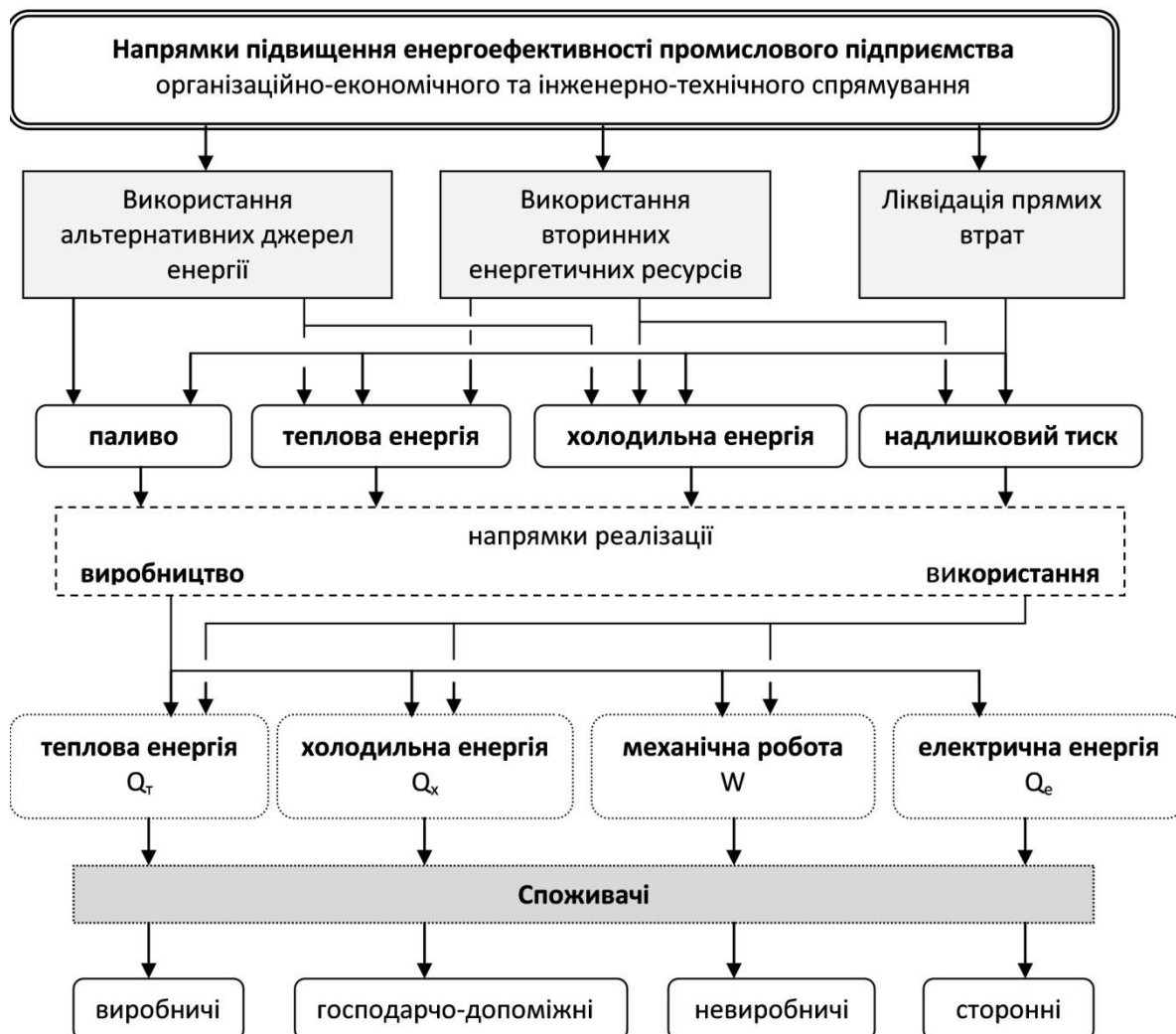
Рис. 2. Напрямки організаційно-економічного і інженерно-технічного спрямування підвищення енергоефективності промислового підприємства (розроблено автором)

Аналіз узагальнюючої схеми розподілу енергетичних ресурсів технологічної установки як ключової структурної одиниці промислового підприємства дозволяє окреслити основні напрямки підвищення енергоефективності виробництва: ліквідація прямих втрат, максимальне використання вторинних відновлювальних ресурсів та альтернативних джерел енергії (рис. 2). Використання альтернативних джерел енергії дозволяє використовувати нетрадиційні палива: біогаз та біомасу. Отримати теплову енергію можна від сонця, холодної енергію – від навколишнього середовища та підземних вод. Отриману альтернативну енергію можна використовувати безпосередньо на виробництві або для генерації інших видів енергії – електричної – від сонячних батарей або вітрових генераторів, механічної роботи різних машин. Споживачами можуть виступати виробничі, невиробничі, господарсько-побутові ланки підприємства або сторонні споживачі, що не належать до даного підприємства. Вторинні енергетичні ресурси у вигляді теплової та холодної енергії і надлишкового тиску також можуть використовуватися безпосередньо або за допомогою утилізаторів на виробництво теплової, холодної, електричної енергії і механічної роботи для вищезначених груп споживачів.