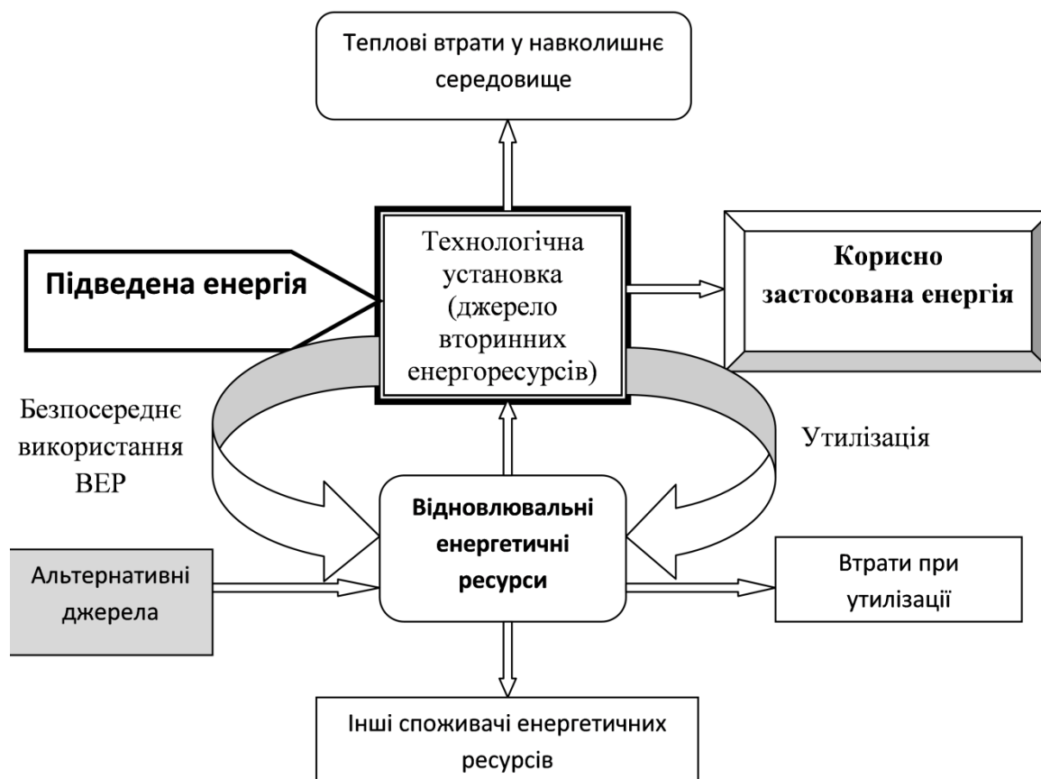
Рис. 1. Узагальнююча схема розподілу енергетичних ресурсів технологічної установки промислового підприємства (розроблено автором)

Основним кінцевим споживачем енергії на підприємстві є технологічна установка (рис. 1). До технологічних установок промислового підприємства можна віднести не тільки установки, що безпосередньо використовуються у виробничому процесі, але і допоміжні пристрої, верстати, конвеєри, печі, підйомники, компресори, котли, вентилятори та інше. Після проходження технологічного процесу утворюється кінцевий продукт і енергетичні та фізичні відходи. Енергія, що безпосередньо використана на виготовлення кінцевого продукту – це корисно застосована енергія. Під час проходження процесу неминучими є теплові втрати від нагрітого обладнання: печей, двигунів, механізмів, систем теплопостачання та інших. Дана енергія є втраченою для установки, але в загальному тепловому балансі підприємства вона враховується, наприклад, на опалення цехів у холодний період. Якщо теплових втрат багато і для їх виведення з цеху необхідно встановлення додаткового холодильного обладнання, то дані відходи вже розглядаються як втрати теплової енергії. Для використання вторинних енергетичних ресурсів у енергетичному балансі підприємства потрібно розглянути структурну схему розподілу енергоресурсів технологічної установки промислового підприємства (рис. 1).