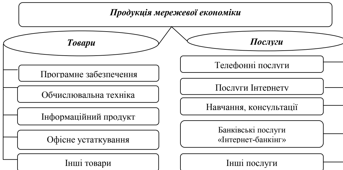
Рис. 2 . Класифікація продукції мережевої економіки Джерело [5]

Стрелец І.А. [15] та Бугорський Н.В. [5] трактують взаємозв'язок мережевої економіки між виробництвом і розподілом мережових благ створенням, продукуванням та поширенням ринків мережових благ. З огляду на це, продукцією мережевої економіки є товари та послуги. На рисунку 2, ми пропонуємо класифікацію товарів та послуг мережевої економіки.