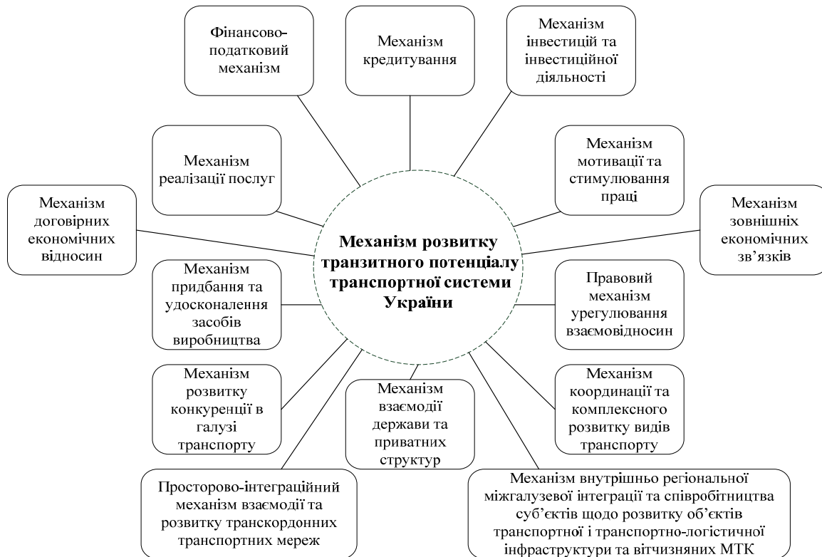
Рис. 1. Складові елементи сучасного механізму розвитку транзитного потенціалу транспортної системи України

Отже, проведений аналіз дозволяє з впевненістю говорити, що вже сьогодні здійснено значні кроки в напрямку реалізації масштабного інфраструктурного проекту з відновлення потужностей транспортної системи України та розвитку її транзитного потенціалу. Україна активно приймає участь у розбудові міжнародних транспортних зв'язків, які відкривають колосальні перспективи для забезпечення енергетичної безпеки країни, відновлення транзитного потенціалу та утвердження України в статусі конкурентоспроможної, економічно сильної держави. Складові елементи сучасного механізму розвитку транзитного потенціалу транспортної системи України визначено на рис. 1.