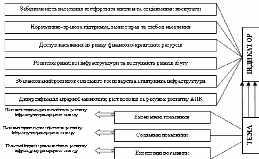
Рис. 2. Індикатори стійкого розвитку для регіону першого типу

Методично розробка ієрархічної системи індикаторів розвитку інфраструктури аграрного сектору на місцевому рівні зводиться до визначення підсистеми місцевих і локальних індикаторів на основі заданих значень ключових базових показників. В ієрархічній структурі кожному індикатору в залежності від умов і напрямів розвитку задається кількісна або якісна оцінка, що обумовлюється типом регіону і наявних агроформувань, а також вмістом індикатора. Згодом дані оцінки підлягають коригуванню та уточненню у міру досягнення поставлених цілей та виконання пріоритетних завдань. З використанням кількісних і якісних оцінок моделюються типові системи розвитку, які можуть бути рекомендовані до використання під час прогнозування і моніторингу соціально-економічного розвитку аграрного сектору.