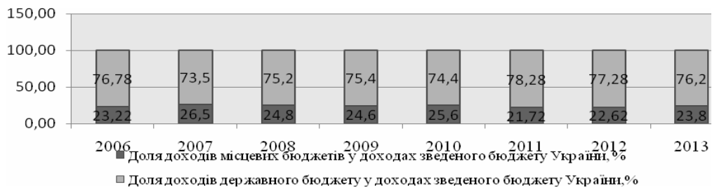
Рис. 1. Співвідношення доходів місцевих та державного бюджетів у структурі доходів зведеного бюджету України [5]

Запропонований показник дає змогу оцінити винятково масштаби перерозподілу суспільних доходів між бюджетами органів влади різних рівнів, не відображає ступінь самостійності територій у питаннях формування та витрачання бюджетних ресурсів і тому може бути застосований лише як допоміжний індикатор.