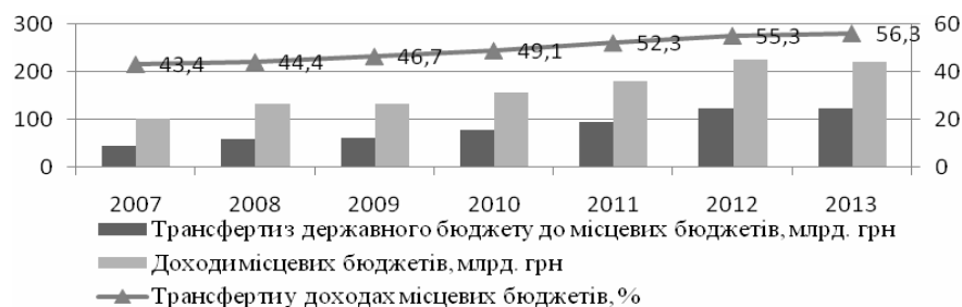
Рис. 2. Динаміка частки трансфертів у доходах місцевих бюджетів, % [12]

З огляду на це актуальною є необхідність зменшення обсягів трансфертів і збільшення обсягів власних і закріплених доходів місцевого самоврядування. З метою реалізації цього завдання необхідно зменшити фіскальні дисбаланси шляхом передання до місцевих бюджетів достатніх джерел доходів, адекватних видатковим потребам місцевого самоврядування, та здійснення послідовної і виваженої державної регіональної політики, спрямованої на зменшення значних відмінностей в економічному розвитку територій.