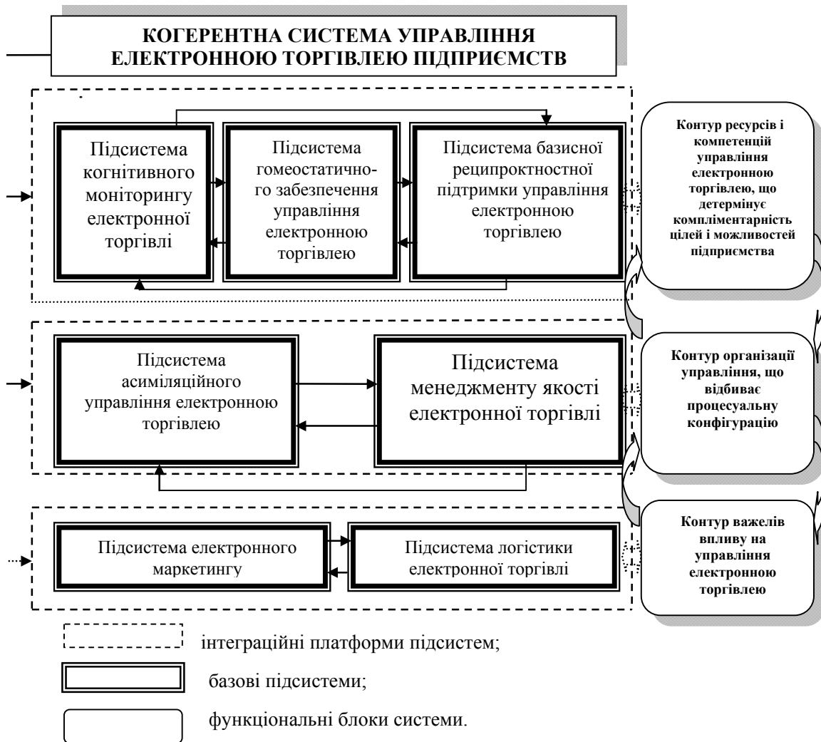
Рис. 2. Візуалізація архітектури когерентної системи управління електронною торгівлею підприємств

Когерентна система управління електронною торгівлею підприємств – це сукупність кореляційно залежних ресурсів і компетенцій, процесів і важелів електронної торгівлі, що відтворюються в процесі реалізації загальних управлінських функцій (рис. 2).