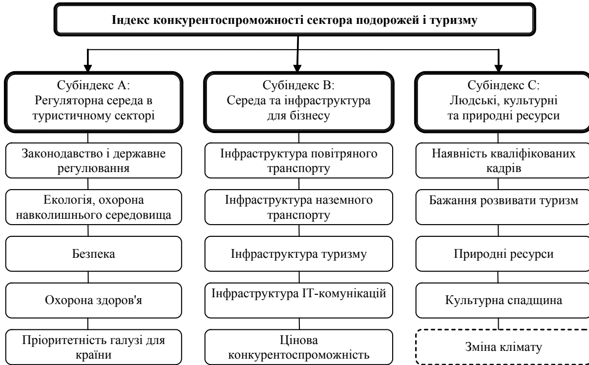
Рис. 1. Складові індексу конкурентоспроможності країн у секторі подорожей і туризму 2006–2013 рр. [2]

Методика складання Індексу конкурентоспроможності подорожей і туризму 2006–2013 рр. ґрунтувалася на 79 показниках, згрупованих в 14 складових. Дані складові, в свою чергу, утворювали 3 субіндекси: «Регуляторна середа в туристичному секторі», «Середа та інфраструктура для бізнесу», а також «Людські, культурні та природні ресурси в секторі подорожей і туризму» (рис. 1).