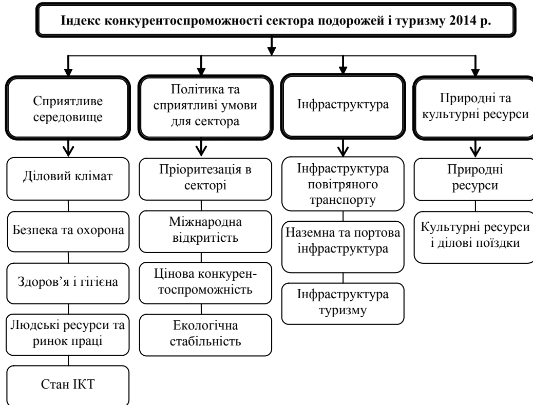
Рис. 2. Складові Індексу конкурентоспроможності країн у секторі подорожей і туризму 2014 р. (адаптовано автором за даними [3])

Оцінки в балах присвоюється індикаторам в межах інтервалу від 1 до 7, причому оцінка «7» відповідає максимально можливій. Кожна із 14 складових розраховується як незважене середнє значення окремих змінних складових (індикаторів). Субіндекси, у свою чергу, розраховуються як незважене середнє відповідних складових.