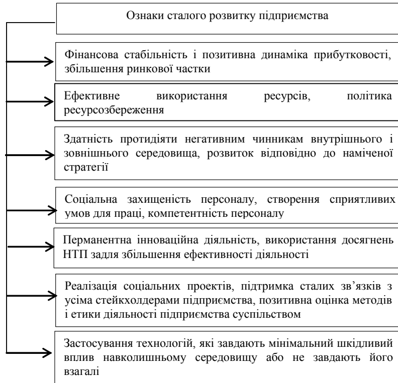
Рис. 1. Ознаки сталого розвитку підприємства

На наш погляд, необхідність організації управління підприємством на засадах сталого розвитку підприємства ілюструють його ознаки (рисунок 1).