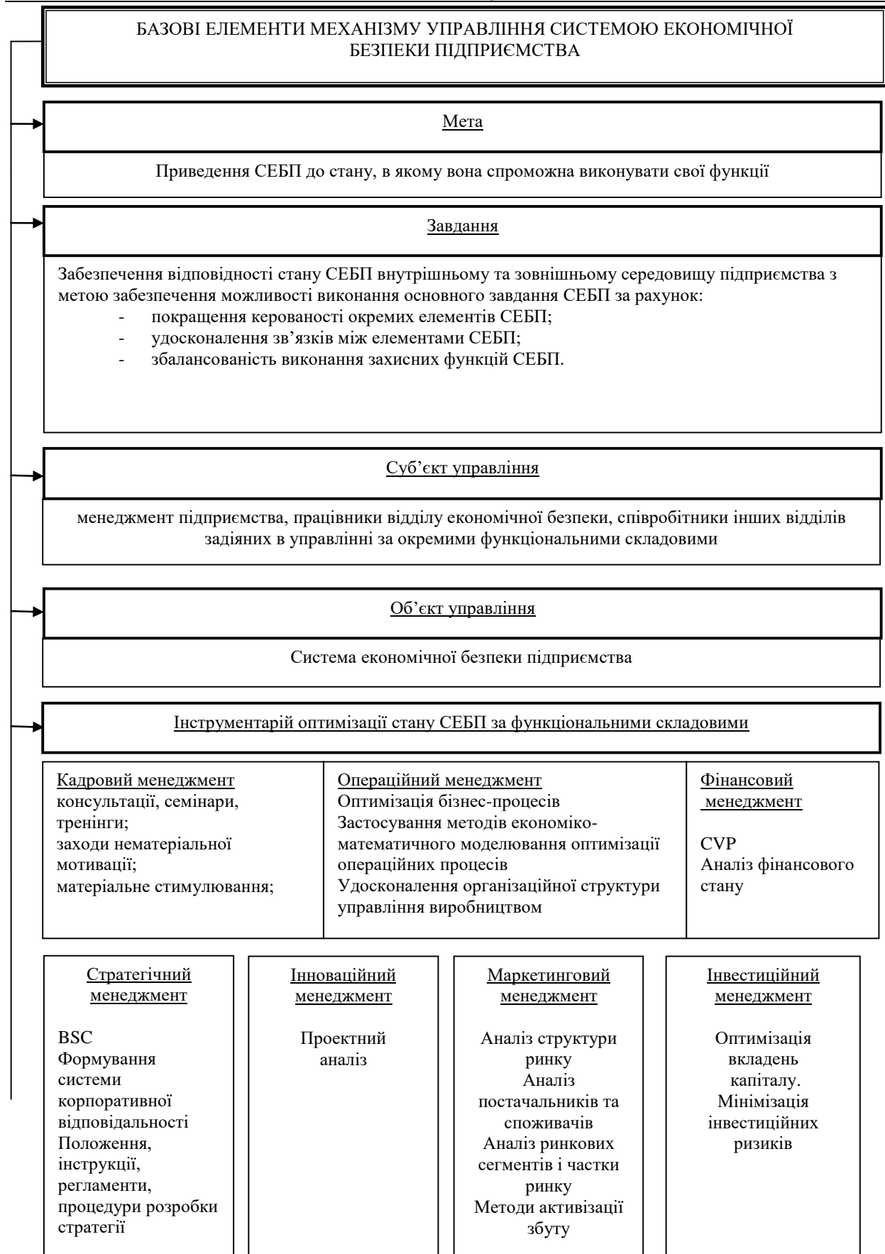
Рис. 1. Базові елементи механізму управління СЕБП (сформовано з використанням [5])

Безпосередня дія суб'єктів реалізується за допомогою інструментарію оптимізації стану СЕБП за функціональними складовими. Для кожного окремого суб'єкта господарювання, що має свої специфічні характеристики та властивості, існує можливість використання певних унікальних підходів або їх