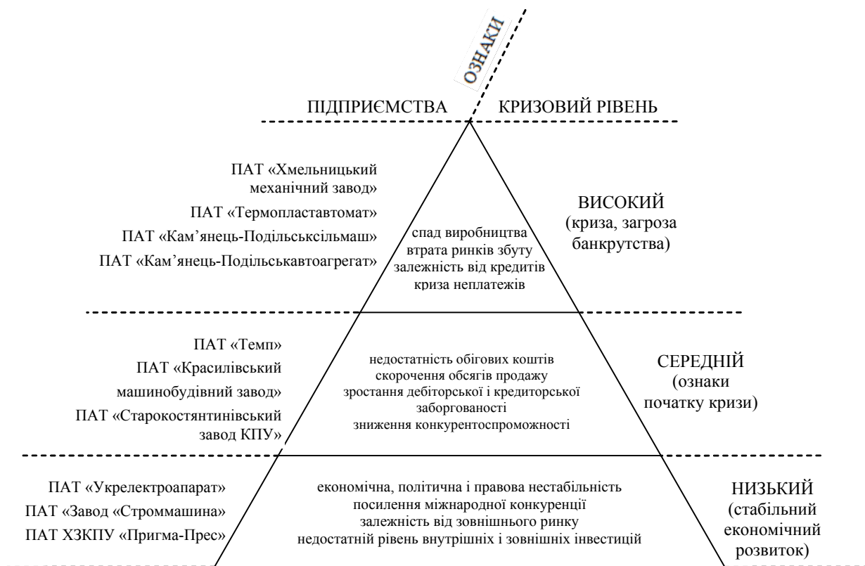
Рис. 2. Класифікація машинобудівних підприємств Хмельниччини відповідно до кризового рівня діяльності

з середнім рівнем – підприємства, які мають первинні ознаки початку кризи, з високим рівнем – підприємства, які перебувають в кризі і знаходяться на грані банкрутства, і тому потребують негайного застосування заходів щодо попередження та подолання банкрутства.